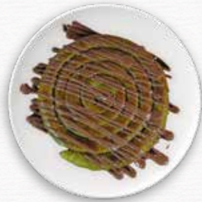
Çikolatalı Dolama Katmer