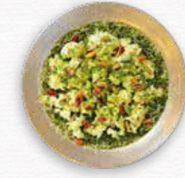
Kaymaklı Paşa Künefe