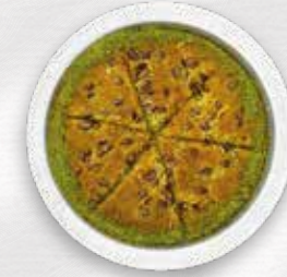
Peynirli Special Künefe