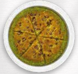
Kaymaklı Special Künefe