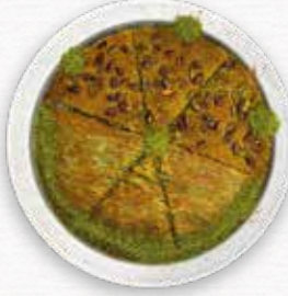
Yarı Hasır Yarı Special Künefe

Künefe, dünyada en bilinen peynirli şerbetli tatlıdır.