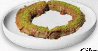
Çikolatalı Simit Katmer